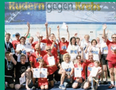
Benefizregatta Starnberg 2007