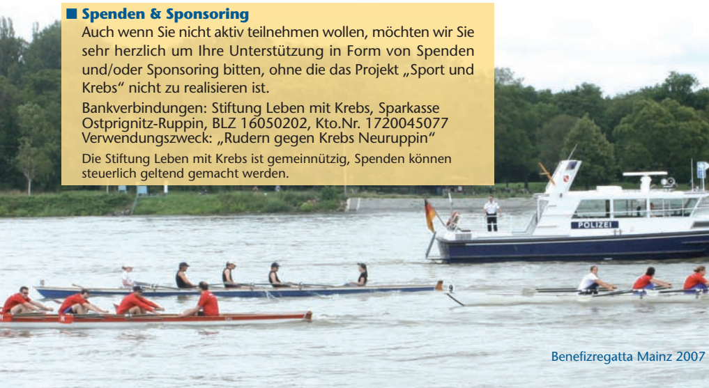
Benefizregatta Mainz 2007

Die Stiftung Leben mit Krebs ist gemeinnützig, Spenden können steuerlich geltend gemacht werden.