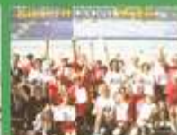
Benefizregatta Starnberg 2007