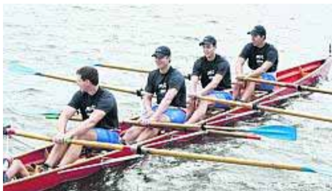
Trotz Dollenbruchs im zweiten Vorlauf holten sich die Märkischen Verleger den Sieg. Alle angetretenen Mannschaften ruderten mit lautstarker Unterstützung der Schaulustigen am Ufer des Ruppiner Sees.

strecken, vorrollen – die Technik ist anspruchsvoll. Der größte Gegner der Ruderer ist