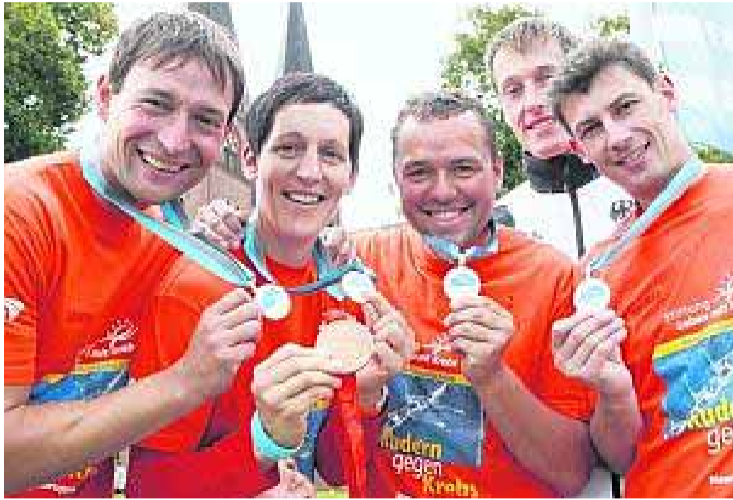
Die prominenteste Verstärkung hatte sich die Mannschaft des Kreissportbundes ins Boot geholt. Mit Spitzensportlerin Kathrin Boron ruderten die Männer im A-Finale auf den fünften Platz.

Nur das Rudern mussten die Teilnehmer selbst übernehmen. Viele haben vor wenigen Wochen zum ersten Mal in einem Ruderboot gesessen. Vorrollen, Blätter einstecken, Blätter drehen, Arme